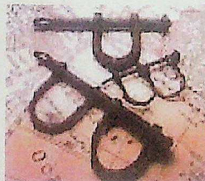
Bui di katibu