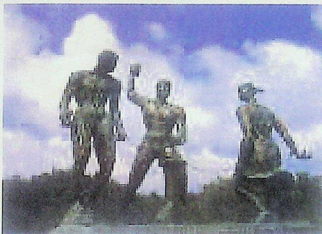
Nòmber ofisial: “Monumentu Lucha pa Libertat” Nel Simon a yama su kreashon: “Desenkadená”

Rat kolonial a kondená 29 luchadó na morto i a laga ehekutá nan den Punda, esaki a sosodé di ougùstùs pa novèmber. E muhé luchadó Diana ta un di esnan ku nan a ehekutá den luna di sèptèmber. Nan a kap su mannan kita afó, pa despues strangul'é na un palu, pasó e la kue su doño Perret Gentil na garganta pa chok'é. Dia 3 di òktober a ehekutá e lidernan di e rebelion. A ehekutá Tula na un manera kruel: a habrak'é di pia te kabes, kima su kara i kap su kabes afó. Bastiaan Carpata mester presensia loka nan ta hasi ku Tula pa despues pasa den mesun kastigu. A lastra Pedro Wacao tras di kabai rònt di e lugá di ehekushon, despues ta kap su mannan kita afó i ta plèchè su kabes ku un mukel. Esaki pasó el a mata e maestro blanku, Sabel. Louis Mercier a haña kastigu di pal'i horka. E kurpanan nan a tira na laman na Ref. A pone kabes di Tula i Bastian riba un staka riba Ref.