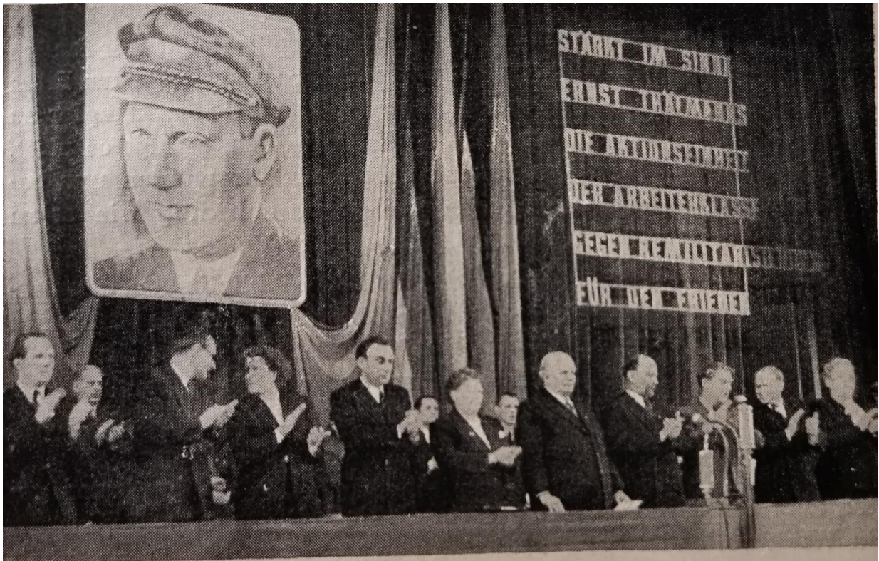
Gedenkfeier anlässlich des 65. Geburtstags Ernst Thälmanns im Friedrichstadtpalast, Berlin.