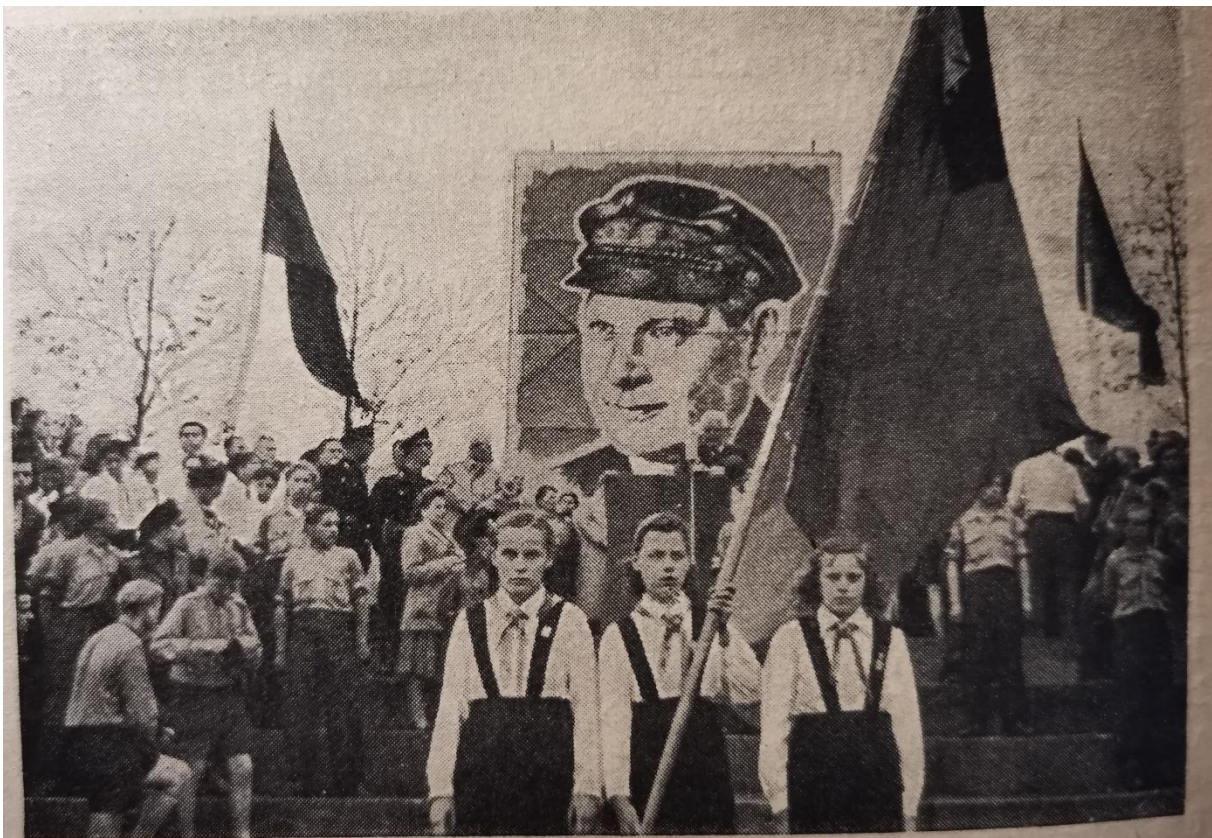
Eröffnung der Pionierrepublik „Ernst Thälmann“ zu den III. Weltfestspielen der Jugend und Studenten in Berlin, August 1951.

„Die Schüsse im Krematorium von Buchenwald haben den Mann getötet, aber sein Geist lebt. In diesem Geiste laßt uns kämpfen, bis wir sein Werk vollendet haben: Frieden den Menschen und Freundschaft mit den friedliebenden Völkern.“