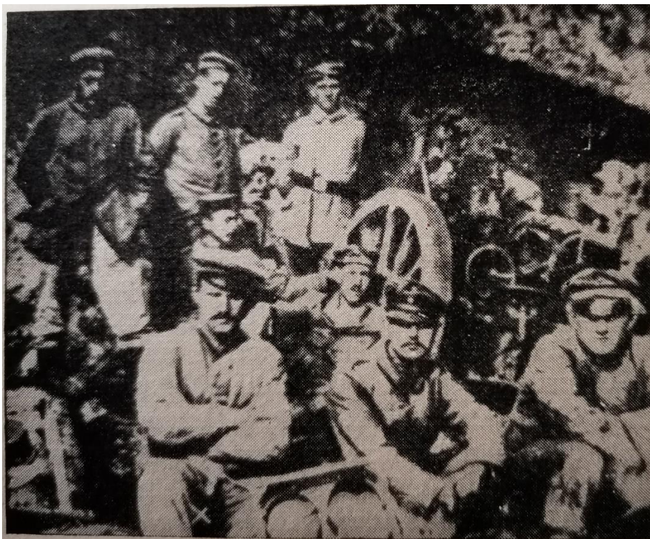
Ernst Thälmann als Soldat.

Neuen Mut schöpfte er für den Kampf gegen den Krieg durch die weitere heldenhafte Tat Karl Liebknechts am 1. Mai 1916. Die tapferen Friedenskämpfer Karl Liebknecht, Rosa Luxemburg, Wilhelm Pieck und ihre Freunde hatten sich im „Spartakusbund“ vereinigt. Diesen Namen hatten sie sich nach Spartakus, dem Führer eines Sklavenaufstandes im Römischen Reich, gegeben.