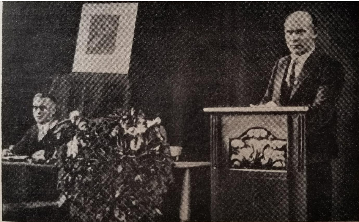
Ernst Thälmann spricht auf einer KPD-Konferenz. Den Vorsitz führt Wilhelm Pieck.

Die Führer dieser neuen Partei, besonders Ernst Thälmann und unser Präsident Wilhelm Pieck, waren sich darüber klar, daß es nun darauf ankam, alle Mitglieder im Geiste des Marxismus-Leninismus zu erziehen. Das war damals eine viel schwierigere Aufgabe als heute. Obwohl die neue revolutionäre Partei mehrere hunderttausend Mitglieder zählte, waren ihre Geldmittel außerordentlich beschränkt. Es gab keine Volkshäuser, wo sie ihre Versammlungen abhalten konnten. Im Lande herrschte große Arbeitslosigkeit.