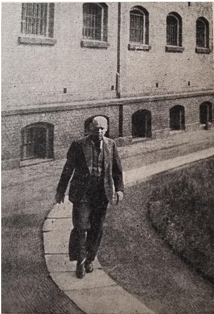
Ernst Thälmann im Hofe des Gefängnisses Berlin-Moabit.

Immer wieder versuchten die Nazihenker, Ernst Thälmanns Glauben an die unüberwindliche Kraft der Sowjetvölker zu erschüttern. Höhnisch lächelnd überbrachten sie ihm die Nachrichten von dem schnellen Vormarsch deutscher Truppen bei dem plötzlichen Überfall auf die Sowjetunion. Als so ein fanatischer Gefängniswärter wieder einmal in seine Zelle trat und von dem baldigen Einzug Hitlers in Moskau sprach, erklärte Ernst Thälmann stolz und sicher: „Stalin bricht Hitler das Genick!“ Das war die unumstößliche Überzeugung von Ernst Thälmann. Nichts konnte ihn in seinem Vertrauen zu der Stärke des Sowjetvolkes und zum großen Stalin erschüttern.